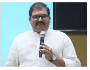
2017లోనే స్కీమ్ గ్ కమిటీ ఏర్పాటైంది. కీలకమైన వచ్చావని అనుమతులు తీసుకొచ్చాం” అని పట్టాభి వివరించారు.

అమరావతి: భోగాపురం విమానాశ్రయానికి అనుమతులు తెచ్చామంటూ వైకాపా అవాస్తవాలను చెప్పింది. రేపటి నేత పట్టాభిరామ్ అన్నారు. 2016లోనే సైట్ క్లియర్ చేసి అనుమతులను సీఎం చంద్రబాబు సాధించారని చెప్పారు. భూసేకరణతో పాటు రైతులకు నష్టం జరగకుండా జీవో ఇచ్చారన్నారు. విమానాశ్రయానికి చంద్రబాబే అనుమతారాజు చేశారని వివరించారు. భోగాపురం విమానాశ్రయంపై పట్టాభి ప్రజెంటేషన్ ఇచ్చారు. “భోగాపురం విమానాశ్రయానికి చంద్రబాబు ఎన్ఎస్ఐ ఏర్పాటుచేశారు. డీఎన్కో సేవ అధికారులను నియమించారు. చంద్రబాబు డ్రిట్ చోరీ చేస్తున్నట్లు వైకాపా పేదీపం బ్యానరులతో పిచ్చిగా అంటున్నారు. వైకాపా పాత్ర లేకపోయినా తామే చేసినట్లు చెప్పుకొంటున్నారని విమానాశ్రయం నిర్మాణాన్ని అడ్డుకుంటామని పార్టీ నేతలు గతంలో వ్యాఖ్యానించారు. భోగాపురం ఎయిర్పోర్టు డ్రిట్ చంద్రబాబుకే దక్కుతుంది. ఈ ప్రాజెక్టు తగినంతానికి