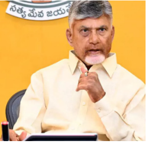
అమరావతి: టీఆర్ అంబేద్కర్ కోసనీమ జిల్లా ఇరుసుమండలో జరిగిన భోజనపుట్ ప్రమాదంపై సీఎం చంద్రబాబు సమీక్ష నిర్వహించారు. ఆ ప్రాంతంలో ప్రస్తుత పరిస్థితులను ఉ